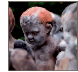
Holger Klassen + Katrin Fröhlich Stand 132

Höhr-Grenzhausen freut sich auf Sie! www.keramik-stadt.de