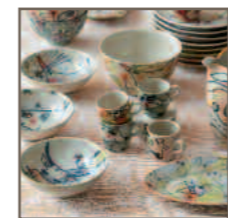
Meyer + Matschke, Stand 120

Museumsfest 2018 im Keramikmuseum Westerwald