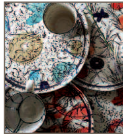
Marta + Karel Pavlinec

Gastland Slowenien Hinter dem Keramikmuseum, auf dem dortigen Plateau präsentiert sich das diesjährige Gastland Slowenien. Die zehn eingeladenen Gäste, vertreten durch 6 Werkstätten, zeigen einen anspruchsvollen Querschnitt und Einblick in das keramische Schaffen ihres Landes.