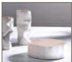
Ulla Litzinger Stand 101