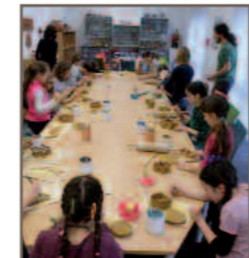
Werkstatt zum Mitmachen

• Mitmachworkshop für die ganze Familie: Die Festtagstafel In unserem Mitmachworkshop widmen wir uns der Festtagstafel. Für ganz besondere Anlässe können Sie hier einen schönen Teller, eine außergewöhnliche Tasse oder eine dekorative Vase herstellen. Unser Team hilft Ihnen, Ihrem Tisch zu Hause eine eigene kreative Note zu verleihen.