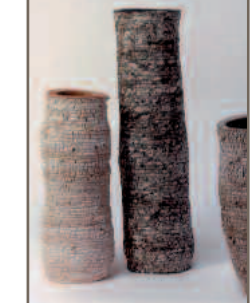
Ruth Stark (B) - Stand 139