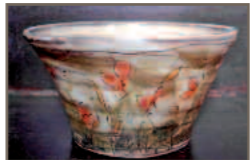
Yoon Gauchot (F) - Stand 114

Töpfermarkt Ransbach - Baumbach: 6./7. Oktober 2018 „Höhr-Grenzhausen brennt Keramik“: 7. April 2019 Keramikmarkt Höhr-Grenzhausen: 1./2. Juni 2019